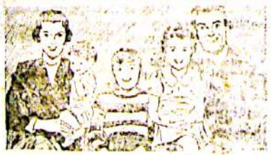
A imunização deve ser feita no momento de seu primeiro ano de vida.

Comunicamos aos srs. Odontólogos e Protéticos que estamos autorizados pela nossa matriz dos E.E.UU. A conceder licença aos interessados para construir peças de «VITALLIUM» na sua própria cidade. Solicitem informações a «CIENTIFICOS VITALLIUM LABORATORIOS», Rua Conselheiro Crispiniano, 29, — 2º andar — salas 91/2/3, End. telegráfico MELVIT—São Paulo.